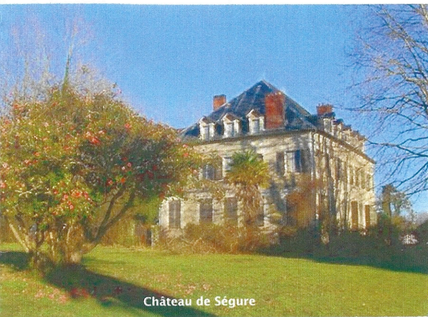
Château de Ségure